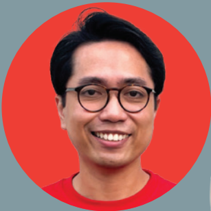
JONATHAN END @jonathanend