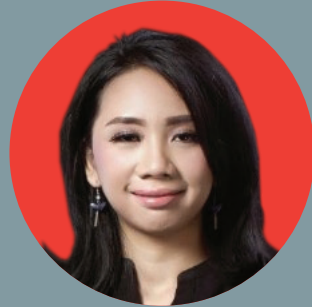
VIRA M. @virastrologer